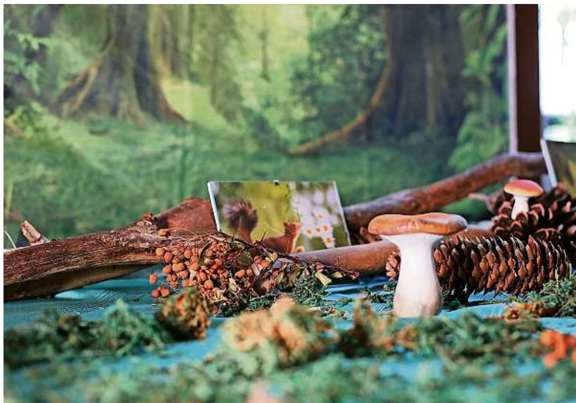
Im Rudolf-Frieling-Haus in Dresden-Rochwitz ist eine ungewöhnliche Idee umgesetzt worden: Hier ist ein Waldspaziergang im Saal der Altenpflege-Einrichtung „gewachsen“.

„Fühlen Sie sich aufgehoben, angesprochen, sind begeistert oder spontan motiviert uns kennenzulernen?“, fragt die Einrichtungsleiterin. Dann sind sowohl zukünftige Bewohner und Bewohnerinnen, als auch Auszubildende, ehrenamtliche Helfer oder neue Mitarbeiter im Rudolf-Frieling-Haus jederzeit herzlich willkommen.