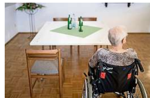
Rollstühle werden komplett bezahlt, wenn sie ärztlich verordnet sind.

Wann kommt die Pflegekasse für die Kosten der Pflegehilfsmittel auf? Das Bundesgesundheitsministerium stellt klar, dass alle Pflegebedürftige – aller Pflegegrade – solche Hilfsmittel beantragen können. Die Kosten werden allerdings nur dann von der Pflegeversicherung übernommen, wenn keine Leistungsverpflichtung der Krankenkasse besteht. Welche Pflegehilfsmittel im Rahmen der Pflegeversicherung zur Verfügung gestellt oder auch leihweise überlassen werden, regelt dabei das Hilfsmittelverzeichnis, das durch den GKV-Spitzenverband der Pflegekassen erstellt wird und sowohl bei den Kassen zu bekommen, als auch auf der Internetseite des Bundesgesundheitsministeriums herunterladbar ist. Klar ist allerdings, dass bei der Kostenübernahme für technische Pflegehilfsmittel ein Eigenanteil von von zehn Pro-