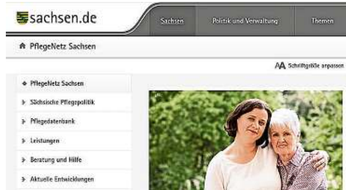
Alles auf einen Blick: Die passende Betreuung, den Antrag dazu und alle Ansprechpartner. Sachsens Pflegedatenbank

E in Unfall? Ein Schlaganfall? Die schlimmer werdende Krankheit? Und plötzlich diese Hilflosigkeit, die Suche nach Hilfe und den richtigen Ansprechpartnern, die genau wissen, was zu tun ist, wo es Hilfe gibt oder einfach auch „nur“, wo der nächste ambulante Pflegedienst zu finden ist. Der Hausarzt, das Gesundheitsamt, die Stadtverwaltung – wer kann in dieser Situation helfen? Das Sächsische Gesundheitsministerium hat versucht, eine Anlaufstelle zu schaffen, in der die meisten dieser Fragen schnell und vor allem einfach beantwortet werden können. Ohne lange Anmeldefristen für einen Termin in einem Amt, sondern ganz einfach mit ein paar