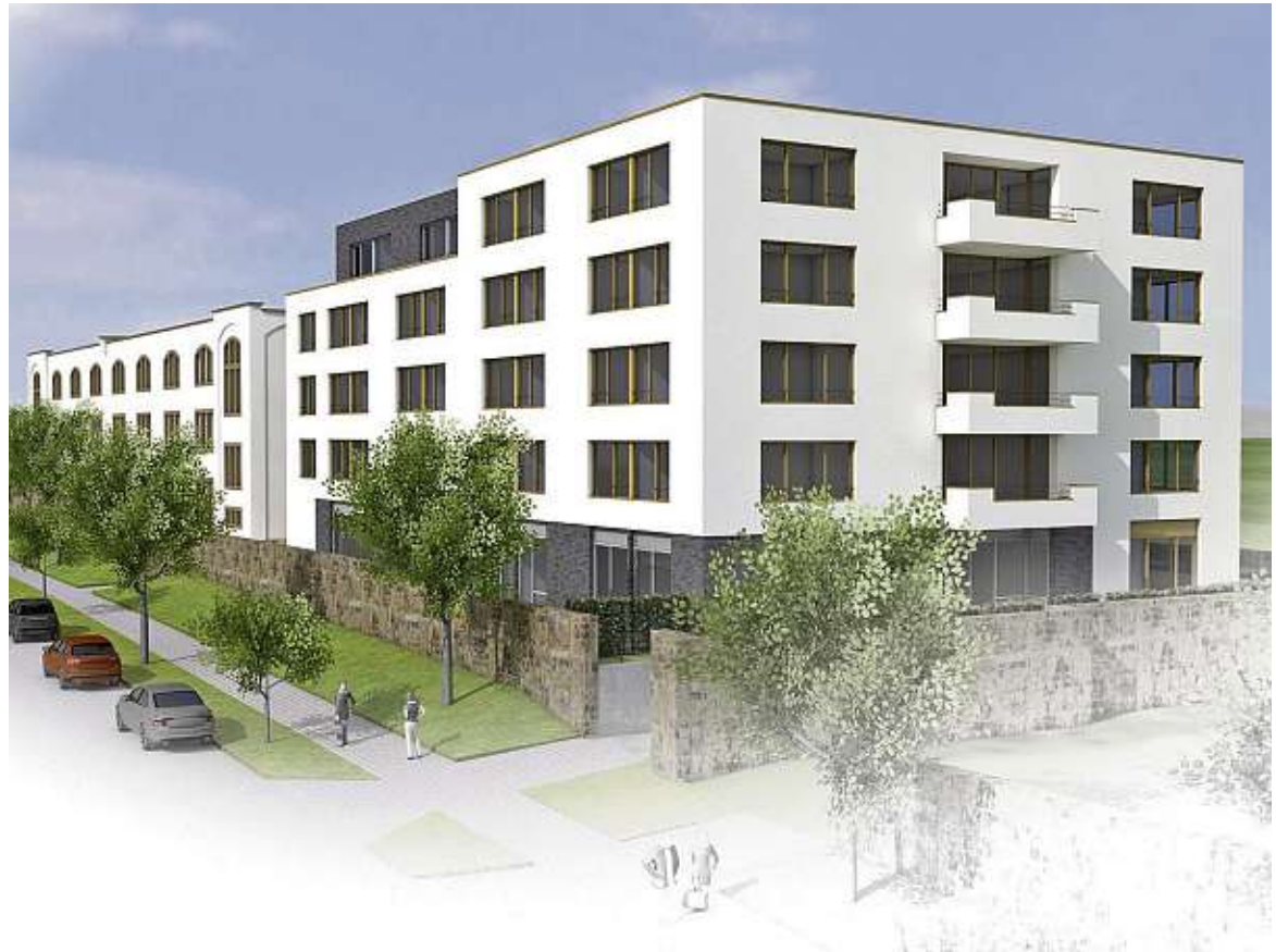
Modern und lebenswert: der Convivo Park Dresden.

S orglos-Wohnen für Senior:innen mit der Sicherheit eines dauerhaften Serviceangebots für alle Pflegegrade. Das Convivo Parks-Konzept stellt den Menschen mit seinen individuellen Bedürfnissen und Bedarfen in den absoluten Mittelpunkt. Seit Eröffnung des ersten Bauabschnitts im April können die ersten der 48 Sorglos-Wohnungen bezogen werden – und die Leistungen des ambulanten Pflegedienstes (Pflege, Betreuung, hauswirtschaftliche Services und ein hochwertiges Speisenangebot) können in Anspruch genommen werden.