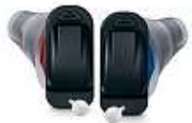
z. B. das Silk 7X von Signia