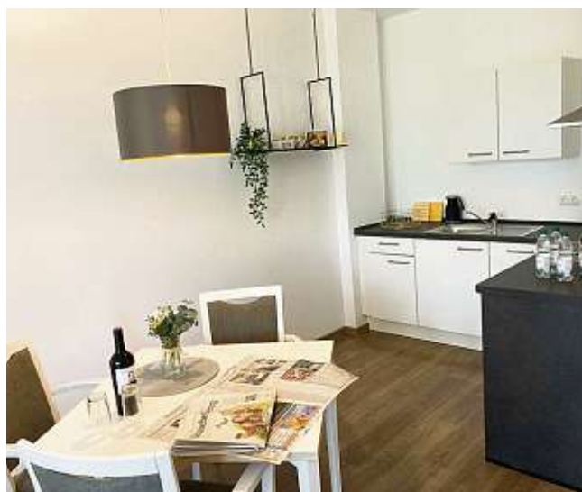
Barrierefreie Wohnungen: gemütlich und auf alle Eventualitäten vorbereitet.